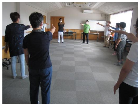
8月18日 リハビリ体操のようす